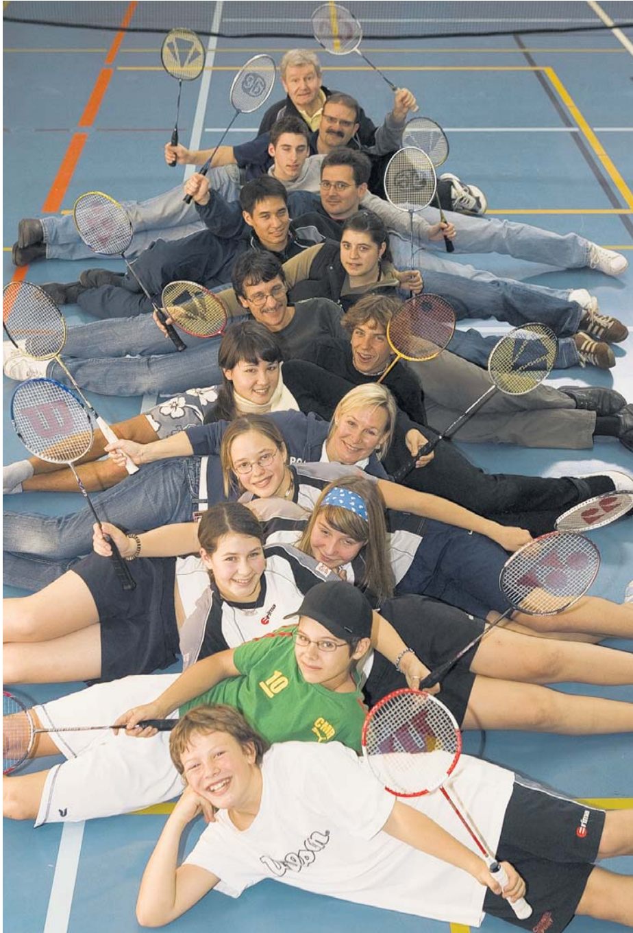
Ettinger Dorfclub. Der Badminton Club Gugger vereint Generationen.

Der Ettinger Badminton Club Gugger ist für seine Nachwuchsförderung bekannt